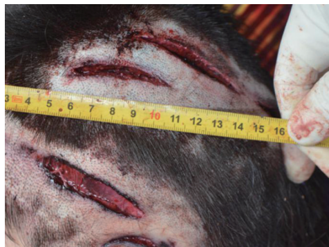
图2 头部损伤 Fig. 2 Head injury

迹浸染,墙面和床前地面见大量小点状血迹。被害人额部左侧及左颞顶部多处条形挫裂创(图2),对应颅骨粉碎性骨折。